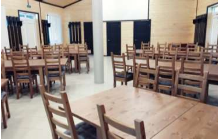
Банкетный зал (в среднем, на 60 человек). С медиасистемой, миникухней