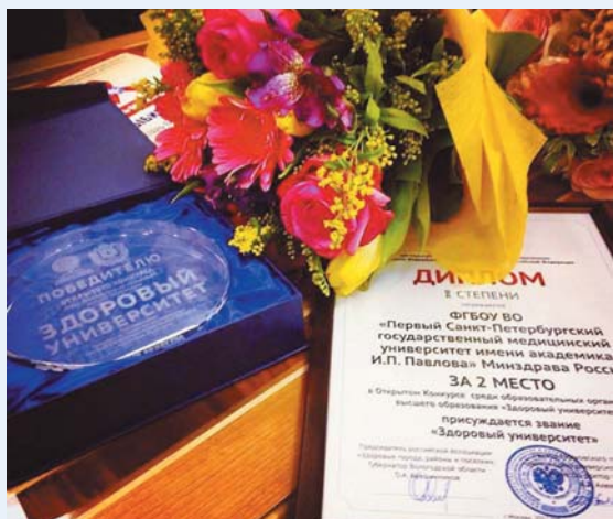
Награда и диплом II степени, полученные Университетом