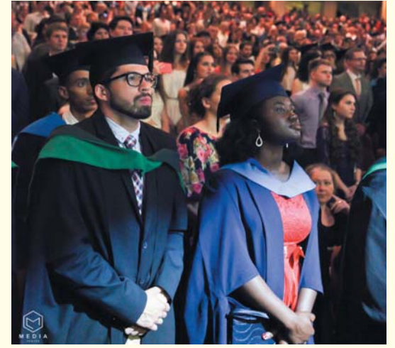
Выпускники факультета иностранных студентов, 2016 год