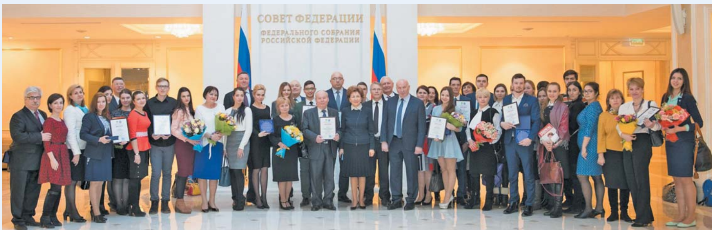
Участники и победители конкурса среди организаций высшего образования «Здоровый университет»