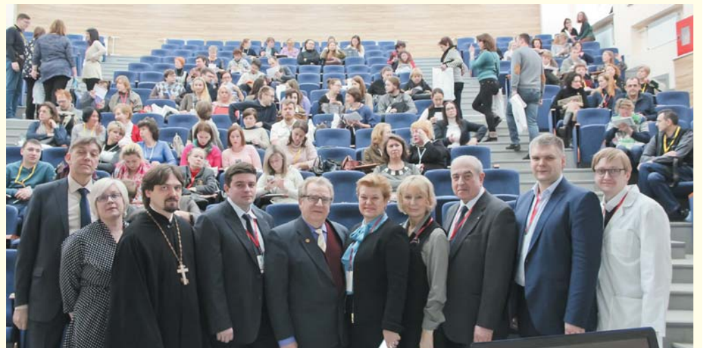
Лекторский состав «Клинико-образовательного комплекса Stroke – 3»