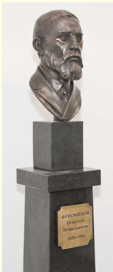
Памятник установлен в холле корпуса № 4 перед входом в аудиторию № 5