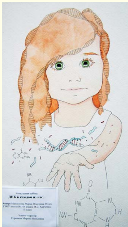
Рисунок – участник конкурса «ДНК – нить жизни» (2016)

Приглашаем вас принять участие в мероприятиях, посвященных Международному дню ДНК – 2017, которые состоятся 27 и 28 апреля.