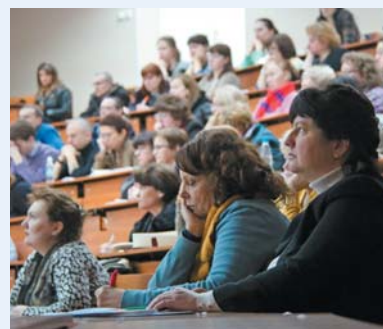
В конференции приняли участие около 300 врачей нашего города и области

Конференция «Избранные вопросы терапии и общей врачебной практики» проводилась под эгидой Санкт-Петербургского общества терапевтов имени С.П. Боткина и Врачебной палаты Ленинградской области как учебное мероприятие в рамках программы непрерывного медицинского образования врачей по двум специальностям – «Терапия» и «Общая врачебная практика (семейная медицина)» и была аккредитована Советом по НМО (ей было присвоено шесть зачетных единиц НМО).