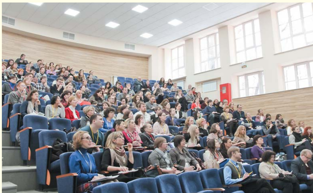
В 2017 году конференцию посетило 200 специалистов мультидисциплинарных бригад: врачей неврологов, реаниматологов, методистов и инструкторов ЛФК, психологов, логопедов и медицинских сестер