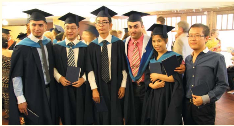
Выпускники факультета иностранных студентов, 2013 год