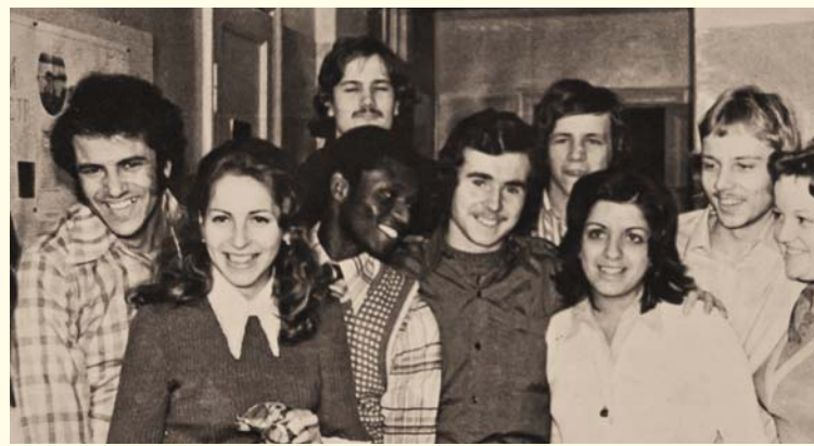
Иностранные студенты ЛЛМИ. Фото из архива газеты «Пuls» (1978)