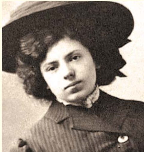
В.М. Инбер, 1920-е годы

История нашего Университета очень интересна, хотя многие ее страницы нами еще не прочитаны. С ней связаны поэты, писатели, чья литературная деятельность началась в период «Серебряного века» русской культуры, когда блистали А.А. Ахматова, В.М. Инбер, А.А. Блок и многие другие. В экспозиции Музея истории ПСПбГМУ представлена небольшая книжка, изданная в 1947 году – это ленинградский дневник «Почти три года войны» В.М. Инбер, в котором отражена жизнь нашего института в годы блокады Ленинграда. Кто же такая Вера Инбер?