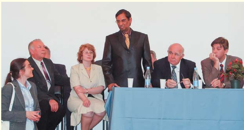
Генеральный консул Республики Индия в Санкт-Петербурге на выпускном мероприятии в Университете (2007)