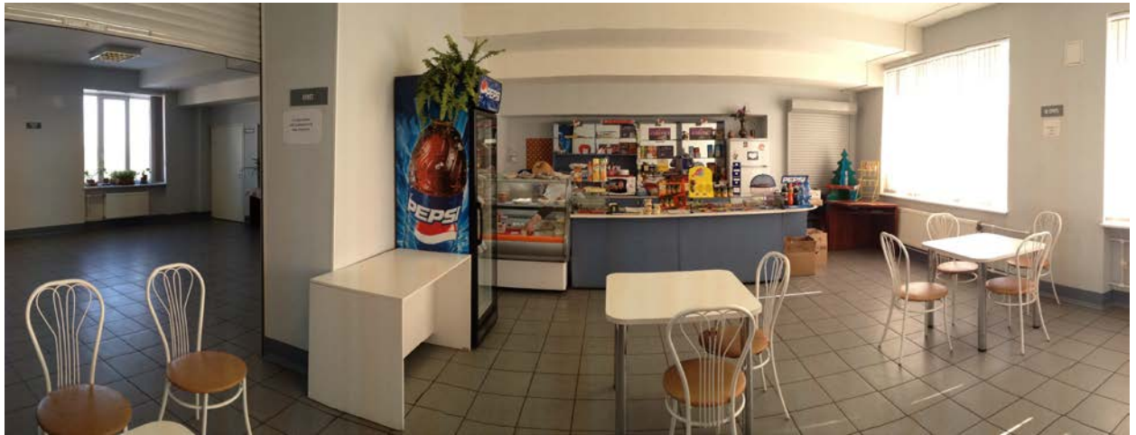
Рис. 1. Буфет НИИ Пульмонологии.

Через буфеты отдела общественного питания Университета реализуются салаты, вторые блюда и выпечка, приготовляемые в столовой, а так же горячие напитки (несколько видов чая и кофе, горячий шоколад). Помимо готовых блюд из базовой столовой, через буфеты организована поставка выпечных, кондитерских изделий и напитков промышленного производства в разовой упаковке. В буфетах предусмотрено все необходимое оборудование. Правила хранения и реализации продукции соблюдаются.