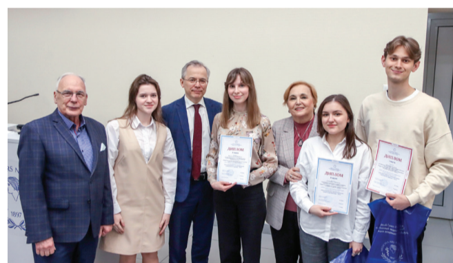
Награждение победителей и призеров конференции «Актуальные вопросы экспериментальной и клинической медицины»

только на вузовских научных конференциях, но также на форумах, организованных другими учреждениями, в том числе с международным участием. СНО объединяет студентов, искренне увлеченных своей профессией, нашедших свое призвание и стремящихся внести вклад в развитие медицинской науки. Научно-исследовательская работа, участие в конференциях позволяет расширить знания по фундаментальным и прикладным вопросам медицины, установить профессиональные контакты и наметить новые творческие планы. В Университете традиционно два раза в год, осенью и весной, проводятся сессии Школы молодого ученого (ШМУ). Многие проявляют большой интерес к этим семинарам, поскольку представители профессорско-преподавательского состава Университета всегда с большой готовностью делятся с молодым поколением своими знаниями и опытом работы. Общеизвестно, что студенты, активно занимающиеся студенческой наукой, становятся специалистами, прославляющими отечественную науку и медицину.