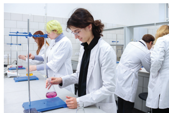
Студенты факультета фундаментальной медицины осваивают основы химии

Программа факультета на 1–3 курсах включает базовые медицинские дисциплины, углубленное изучение биологии, химии, физики, математики и программирования. На 4–5 курсах преподаются общие для врача-биохимика и врача-кибернетика компетенции в области биотехнологий, доклинических и клинических исследований. На 5–6 курсах у врача-биохимика реализуется уклон образовательных программ в сторону клинической лабораторной диагностики, а у врача-кибернетика – в лучевые и ультразвуковые методы исследования, информатизацию в медицине. В процессе всего обучения приоритет отдается