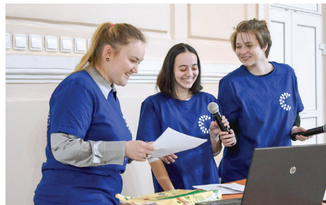
Психологический тренинг. 7 марта 2024 года

Совет обучающихся ПСПбГМУ им. акад. И.П. Павлова – это команда неравнодушных и энергичных студентов, готовых развиваться, осваивать новые умения. Мы участвуем в крупных мероприятиях вуза, города, страны, посещаем форумы и конференции, реализуем новые проекты и делаем нашу студенческую жизнь насыщенной, увлекательной и яркой. Вы вступаете в новый этап жизни, он не будет легким, и для каждого человека важно в моменты трудностей получить поддержку. Для этого и создан Совет обучающихся. Здесь вам всегда помогут старшие товарищи, вы сможете завести новые знакомства и вместе быть одной студенческой семьей Первого медицинского университета. Подписывайтесь на нашу группу, следите за студен-