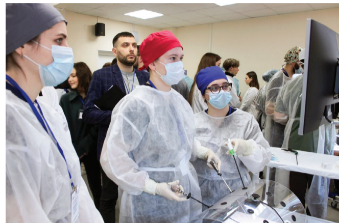
Студенты демонстрируют свои навыки по эндовидеохирургии

Образован в 2008 году. Обучение длится в течение 6 лет, выпускники получают квалификацию врача по специальности «педиатрия». Кроме традиционных дисциплин студенты-педиатры дополнительно осваивают анатомо-функциональные особенности детского организма, пропедевтику детских болезней, уход за здоровым и больным ребенком, факультетскую, госпитальную и поликлиническую педиатрию, детскую хирургию, неонатологию и т.д.