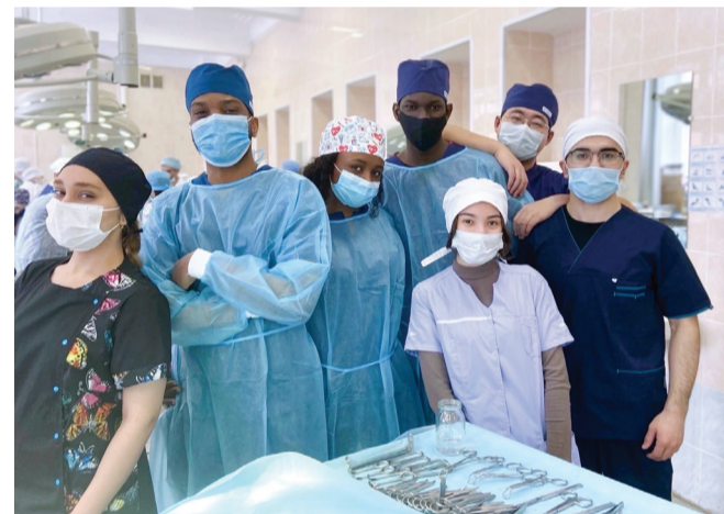
Студенты медицинского факультета иностранных студентов

В настоящее время многие иностранные выпускники работают в США, Канаде, странах Европы, Африки и Азии. Некоторые из них являются ведущими специалистами в своей области.