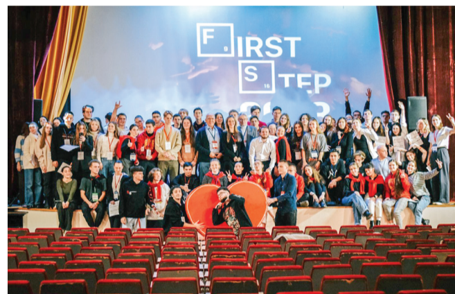
Выездная школа профсоюзного актива First step