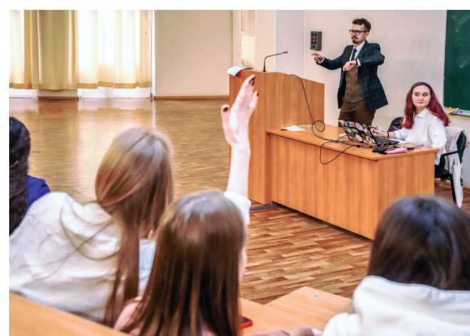
Студенты отделения на конференции по клинической психологии. 16 октября 2021 года

В приоритете работы со студентами является воспитание в них ответственного отношения к будущей профессии, формирование практических навыков оказания психологической помощи, активности и равнодушия к общественной жизни Университета и России.