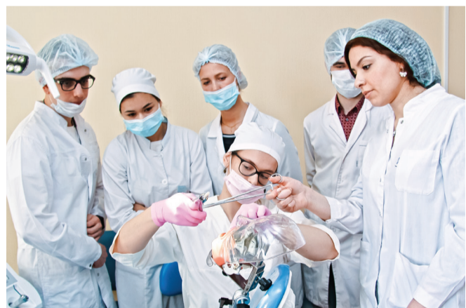
На занятиях участники СНО — студенты стоматологического факультета

Факультет основан в 1959 году. Осуществляется подготовка врачей-стоматологов по специальности «стоматология». Срок обучения — 5 лет. Форма обучения — очная, как для абитуриентов — выпускников школ, так и для лиц, имеющих среднее профессиональное образование, по специальностям «зубной врач», «зубной техник», «гигиенист стоматологический».